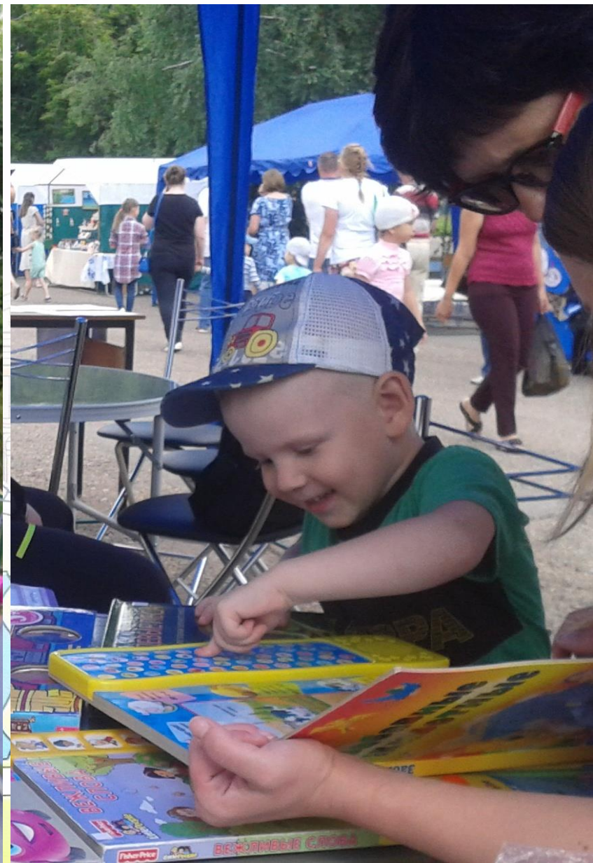
Презентация детских книг