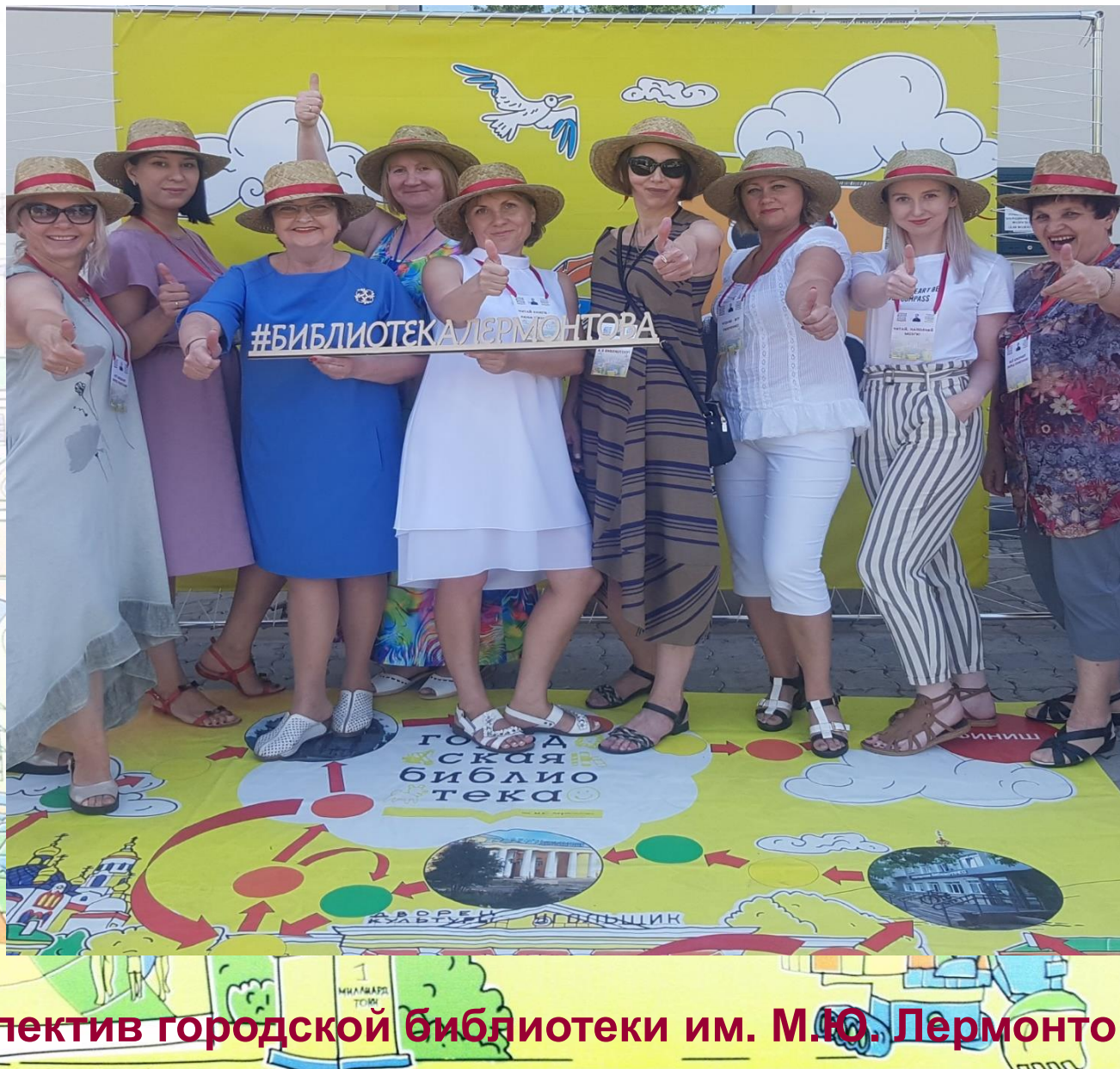
Коллектив городской библиотеки им. М.Ю. Лермонтова