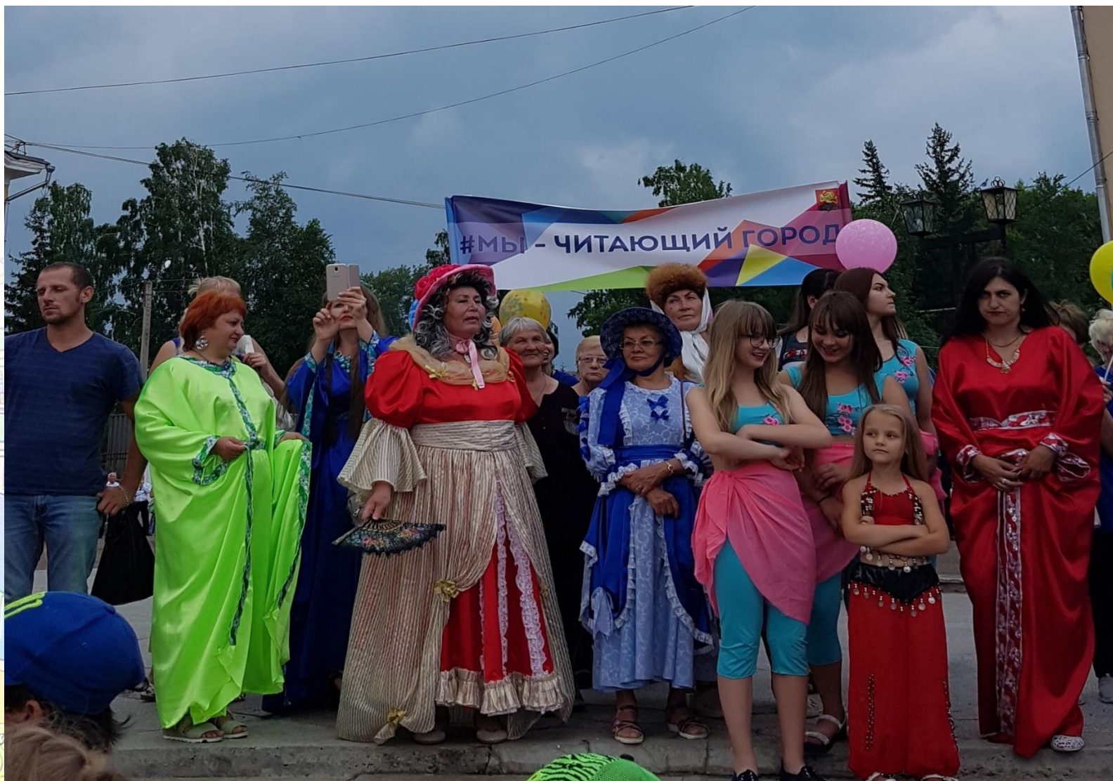
Участники парада литературных героев